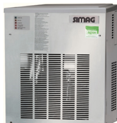
SPN 125 | SPN 405 SPN 255 | SPN 605