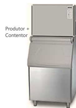
Produtor + Contentor