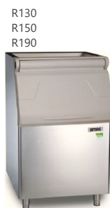
R130 R150 R190