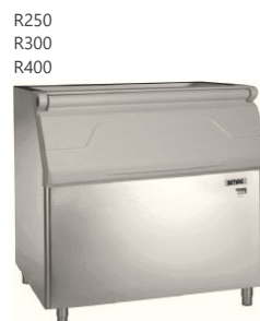
R250 R300 R400