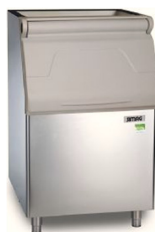
R250 R300 R400