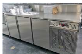
Balcão vista posterior