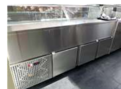
Vitrine vista posterior