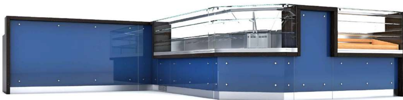
Exemplo de Balcão