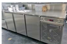
Balcão vista posterior