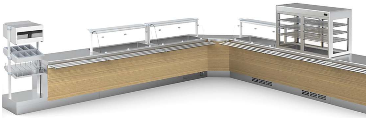
Exemplo de Self-service