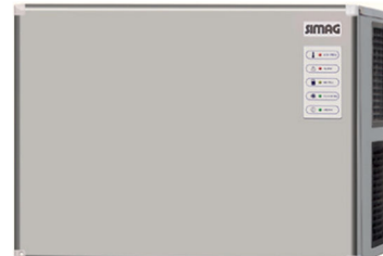
SVD 203 SVD 303 SVD 503