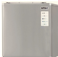
SVD 152 SVD 222