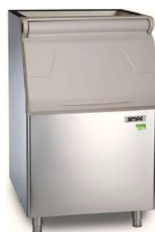
R250 R300 R400