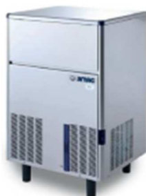
SMN 45 SMN 75