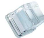
SCN 35 SCN 45