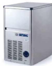
SDE 18 SDE 24