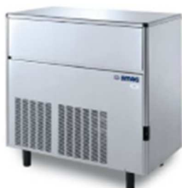
SDE 170 SDE 220