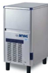
SDE 40 SDE 50