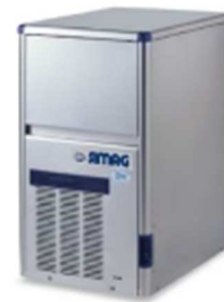
SDE 30 SDE 34