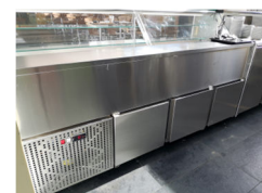
Vitrine vista posterior