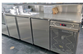
Balcão vista posterior