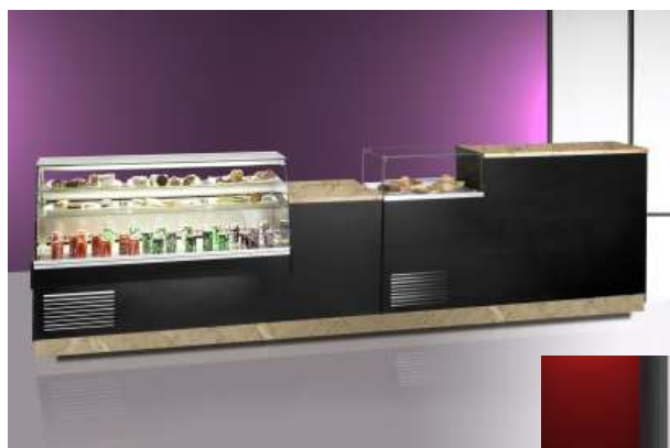
Exemplo de decoração. Disponível em madeira e lacado